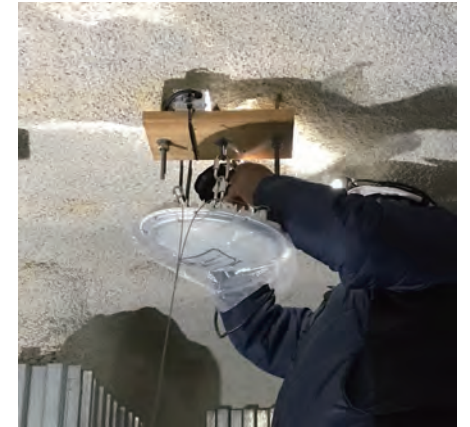
簡単に取付け可能