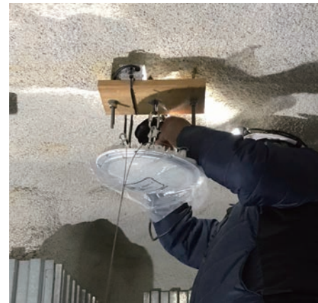
簡単に取付け可能