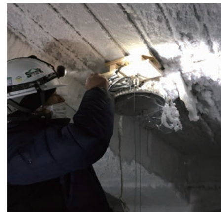
※器具の設置施工には電気工事士の資格が必要です。施工は必ず工事店にご相談ください。